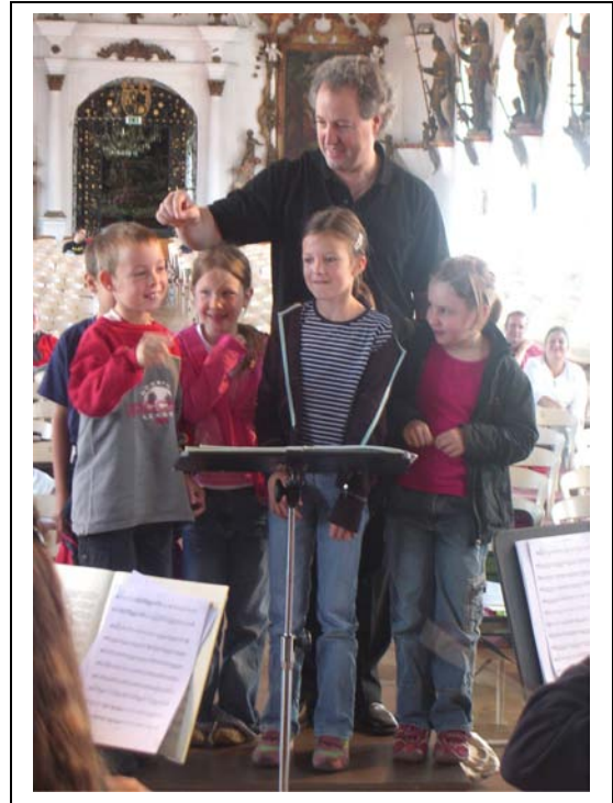
Der Dirigentennachwuchs der Grundschule Wolfegg mit Manfred Honeck bei der Orchesterprobe