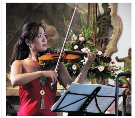
Die koreanische Violinistin Che Yun als Solistin in Vivaldis „Vier Jahreszeiten“