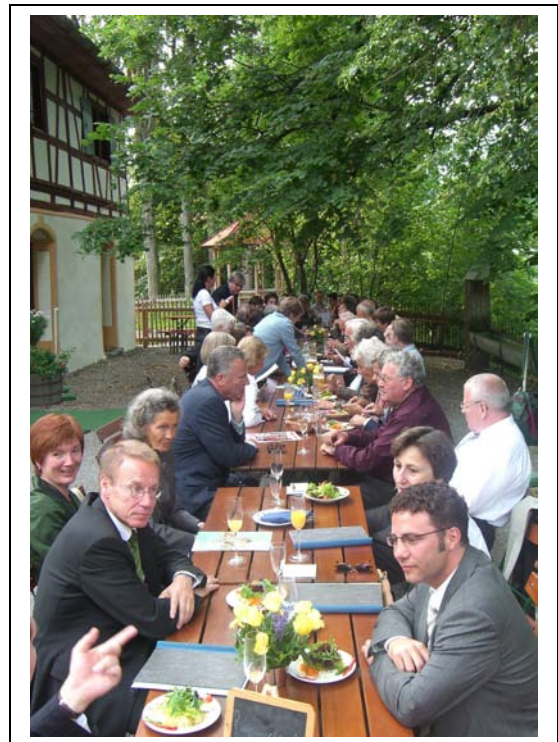
Mitglieder des Freundeskreises und Helferinnen und Helfer beim gemütlichen Ausklang nach dem Kirchenkonzert