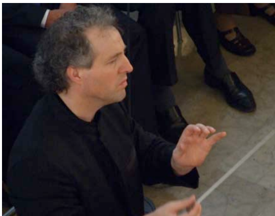
Manfred Honeck dirigiert das Kirchenkonzert