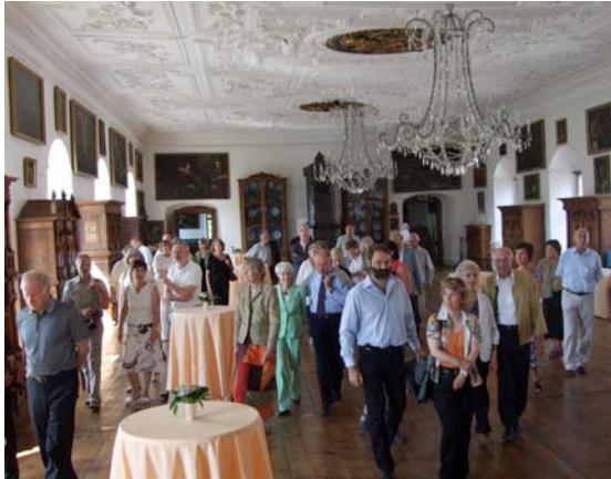
Konzertbesucher bei der nachmittäglichen Schlossführung