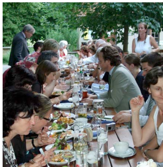
Gemütlicher Ausklang des Konzertwochenen- des in der Gaststätte Fischerhaus