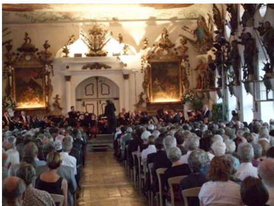
Das Orchesterkonzert im Rittersaal von Schloss Wolfegg